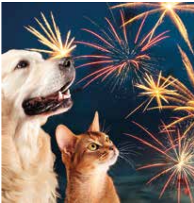
Hunde und Katzen sollten während des Feuerwerks nicht allein gelassen werden.