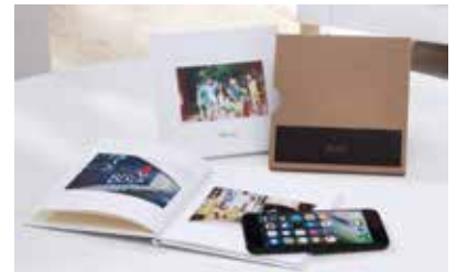
Für eine tolle Erinnerung sorgt ein Fotobuch, das sich bereits während der Feier per App mit Fotos füllen lässt.

fies lassen sich direkt am Abend der Feier per App zu einem „Cewe Fotobuch Pure“ zusammenfügen. App öffnen, Fotos auswählen und schon ist das Silvester-Fotobuch fertig gestaltet und kann direkt bestellt werden. Ein schönes Dankeschön für den Gastgeber oder eine Erinnerung für alle Partyteilnehmer. Weitere Dekotipps gibt es unter www.cewe.de . rgz