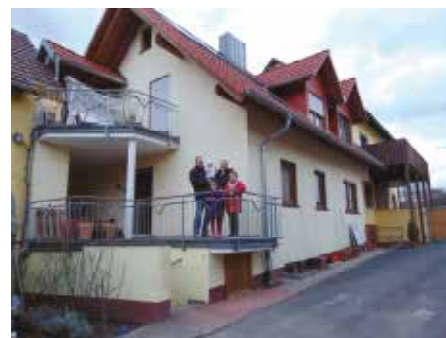
Auf dem Grundstück in Elfershausen leben vier Generationen zusammen

VORTRAGSREIHE „MITTEN IM ORT - mitten im Gespräch“