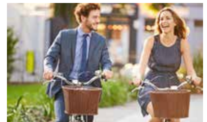
Studien haben erwiesen, dass das Radeln zur Arbeit glücklich machen kann.

Etwa 2,8 Millionen Bundesbürger fahren nach Angaben des Allgemeinen Deutschen Fahrrad-Clubs mit dem Rad zur Arbeit. Damit tun sie ihrer Gesundheit etwas Gutes, entlasten die Umwelt und den Geldbeutel. Fit macht das Radeln aber nur, wenn es keine Schmerzen verursacht. Man sollte darauf achten, dass das Rad auf die individuellen Bedürfnisse eingestellt ist. Zur richtigen Sitzposition und zum passenden Sattel können spezialisierte Fachhändler beraten. Sie messen mit einem Physiotherapeut die Druckbelastung am Sattel und ermitteln die korrekte Sitzgeometrie. Unter www.die-sattelkompetenz.de gibt es ein bundesweites Verzeichnis der Fachhändler, die diesen Service anbieten. rgz