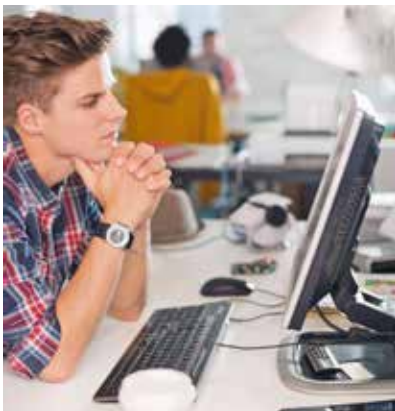
Bürokaufleute finden bei Berufsgenossenschaften eine fundierte Ausbildung.