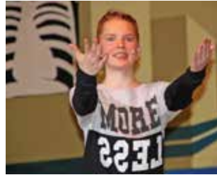
Nüdlinger Carnaval Club