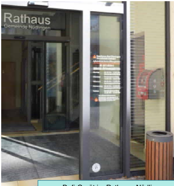
Defi-Gerät im Rathaus, Nüdlingen

Eigentlich beschäftigen wir uns im Alltag viel zu wenig mit diesem Thema. Aber sollte einmal der Notfall eintreten, weiß man dann auf die Schnelle, wo der nächste Defibrillator angebracht ist? In Nüdlingen findet man den neuen Defibrillator im Vorraum des Rathauses in der Kissinger Straße 1. Bei Betreten des Gebäudes ist das Gerät auf der rechten Seite neben dem Eingang zur Sparkasse kaum zu übersehen. In Haard hängt das Gerät am Buswartehäuschen des Berthold-Hehn-Platzes. Die Handhabung der Defibrillatoren ist auch für Laien leicht verständlich, der Bediener wird komplett elektronisch über das Gerät angeleitet, sodass kein Bedienungsfehler unterlaufen kann.