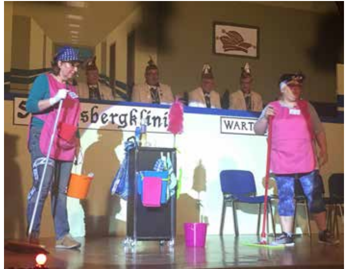
Elferratsitzung in der Schlossbergklinik