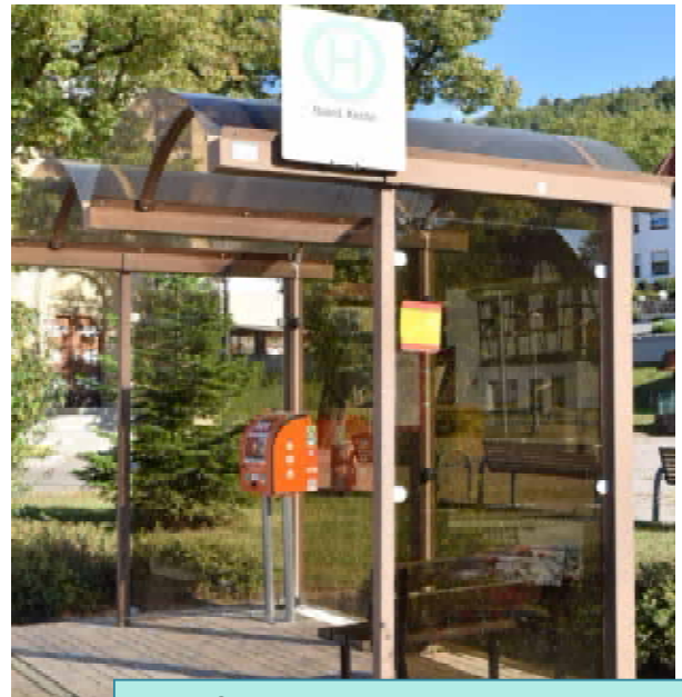
Defi-Gerät am Berthold-Hehn-Platz, Haard