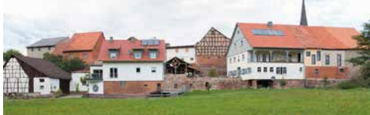
Hier zwei Beispiele aus Oberthulba, Anwesen Mühlgasse 1 + 3