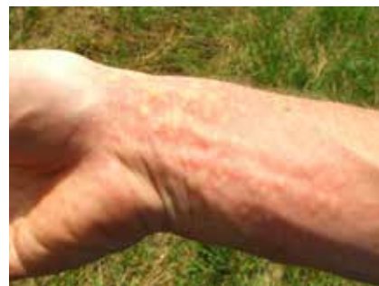
Durch Brennhaare verursachte Hautreaktion

Sollten Sie während der Arbeit Hautreaktionen oder Atemwegsbeschwerden feststellen, brechen Sie Ihre Tätigkeit umgehend ab und suchen Sie einen Arzt auf. Treten Krankheitssymptome zeitverzögert auf, sollte ebenfalls ein Arzt aufgesucht werden. Informieren Sie ihn, dass ein Zusammenhang zwischen den Symptomen und den Brennhaaren des Eichenprozessionsspinners möglich sein kann.