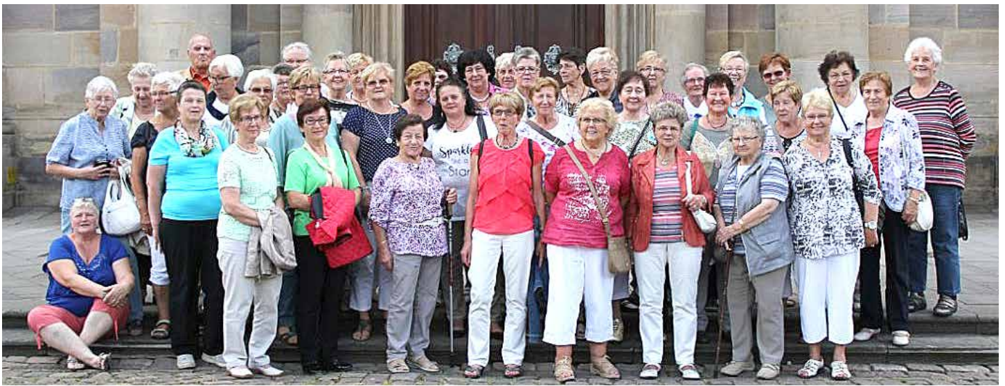
Die Damen-Gymnastikgruppe der DJK bei ihrem diesjährigen Ausflug.