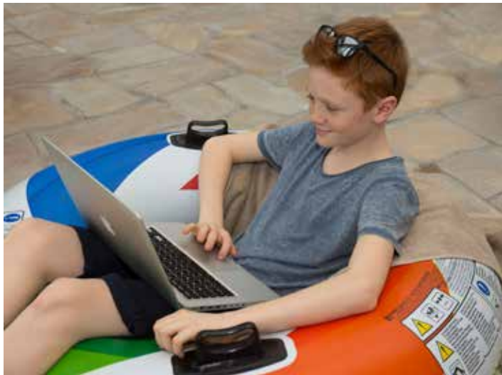
Ein internetfähiges Endgerät und ein Headset reichen, um Einzel-nachhilfe im Online-Ferienkurs zu erhalten.