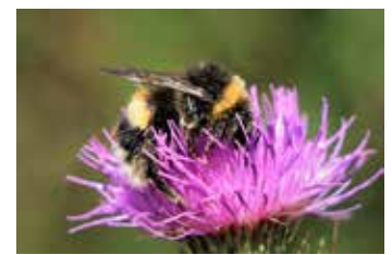
Hummeln sind häufige Besucher von Korbblütlern.

Pollenträger sind unter anderem wichtige Nützlinge in der Forst- und Landwirtschaft und stellen einen Großteil der menschlichen und tierischen Ernährung sicher. Ohne Bienen und Co. wäre aber auch unser subjektives Naturerleben um einiges ärmer. Wie traurig wäre ein Sommer ohne das tiefe Brummen der Hummeln, den luftigen Tanz der Schmetterlinge oder den glücksbringenden Marienkäfer auf der Hand. Naturfreunde und Gartenbesitzer können durch eine insektenfreundliche Bepflanzung viel dazu beitragen, dass es bei uns weiterhin summt, schwirrt und krabbelt.