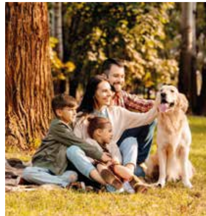
Zeckenstich: Der Klimawandel bringt zunehmend Gefahren für Mensch und Tier.

(djd). Es steht schlecht um Insekten. Immer häufiger alarmieren Studien über die dramatischen Verluste sowohl im Artenreichtum als auch in der Biomasse. Das hat drastische Folgen für das Ökosystem - die