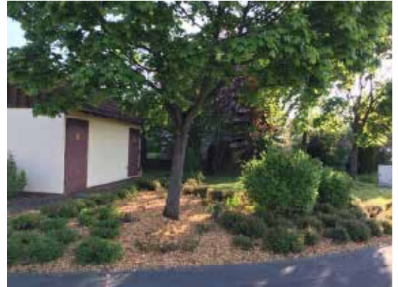
Frisch gestaltete Grünanlage am Aschacher Weg Ecke Mehlesweg

Bei Interesse schreiben Sie bitte eine E-Mail an bauhof@nuedlingen.de unter Angabe Ihres Namen, Anschrift, Telefonnummer und Menge. Ein Mitarbeiter wird sich mit Ihnen in Verbindung setzen und einen Abholtermin vereinbaren.