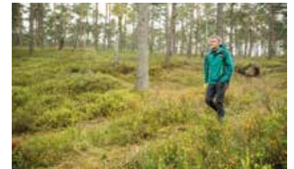
Vorsicht: Bis zu 50 verschiedene Krankheitserreger können Zecken übertragen.

Beim Geocaching handelt es sich um eine Schatzsuche mit GPS-Geräten: Die im Freien versteckten Behältnisse müssen anhand von Koordinaten gefunden werden. Bei der Suchenachinem „Cache“ begeben sich die Abenteurer in Wälder, Wiesen, kriechen durch Laub und Unterholz und befinden sich dabei mitten im Zeckenrevier. Zecken können ab sieben Grad Celsius aktiv sein, durch die milden Winter stellen sie nahezu ganzjährig eine Gefahr dar. Die kleinen Spinnentiere übertragen durch ihre Stiche gefährliche Krankheitserreger wie Borreliose-Bakterien oder Frühsommer-Meningoenzephalitis-(FSME-)Viren. Mit der richtigen FSME-Vorsorge, etwa durch Impfen, kann man die Geocaching-Saison aber unbeschwert genießen. Infos: www.zecken.de djd-mk