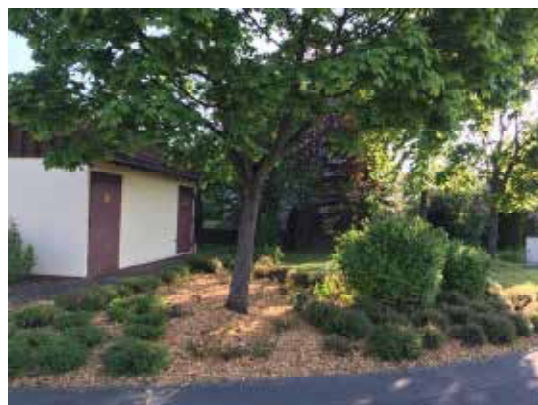
Frisch gestaltete Grünanlage am Aschacher Weg Ecke Mehlesweg

Bei Interesse schreiben Sie bitte eine E-Mail an bauhof@nuedlingen.de unter Angabe Ihres Namen, Anschrift, Telefonnummer und Menge. Ein Mitarbeiter wird sich mit Ihnen in Verbindung setzen und einen Abholtermin vereinbaren.