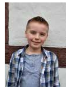
Sebastian Rudolf Hochstr. 29

Vorstellung der Kommunionkinder in der Vorabendmesse am 16.03.2024 um 18:00 Uhr