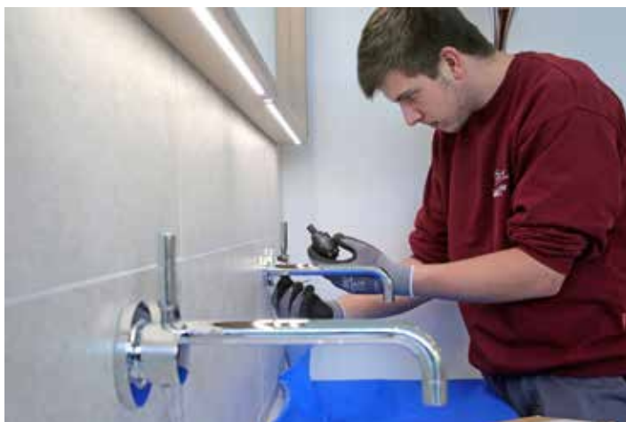
Berufsbilder in der SHK-Branche sind vielseitig und bieten sehr gute Entwicklungsperspektiven.

Berufsschule verbindet. Die Lehrzeit wird mit dem Gesellenbrief oder als Kauffrau/-mann abgeschlossen. Danach eröffnen sich viele Aufstiegsmöglichkeiten. Im Handwerk führt der weitere Karriereweg meist über den Meisterbrief, Kaufleute können eine Vielzahl von Weiterbildungs- und Höherqualifizierungsangeboten nutzen und sich auf bestimmte Bereiche spezialisieren. Auch ohne Abitur sind nach einer abgeschlossenen Berufsausbildung und etwas Berufserfahrung berufsbegleitende Studiengänge oder Vollzeitstudien zugänglich.